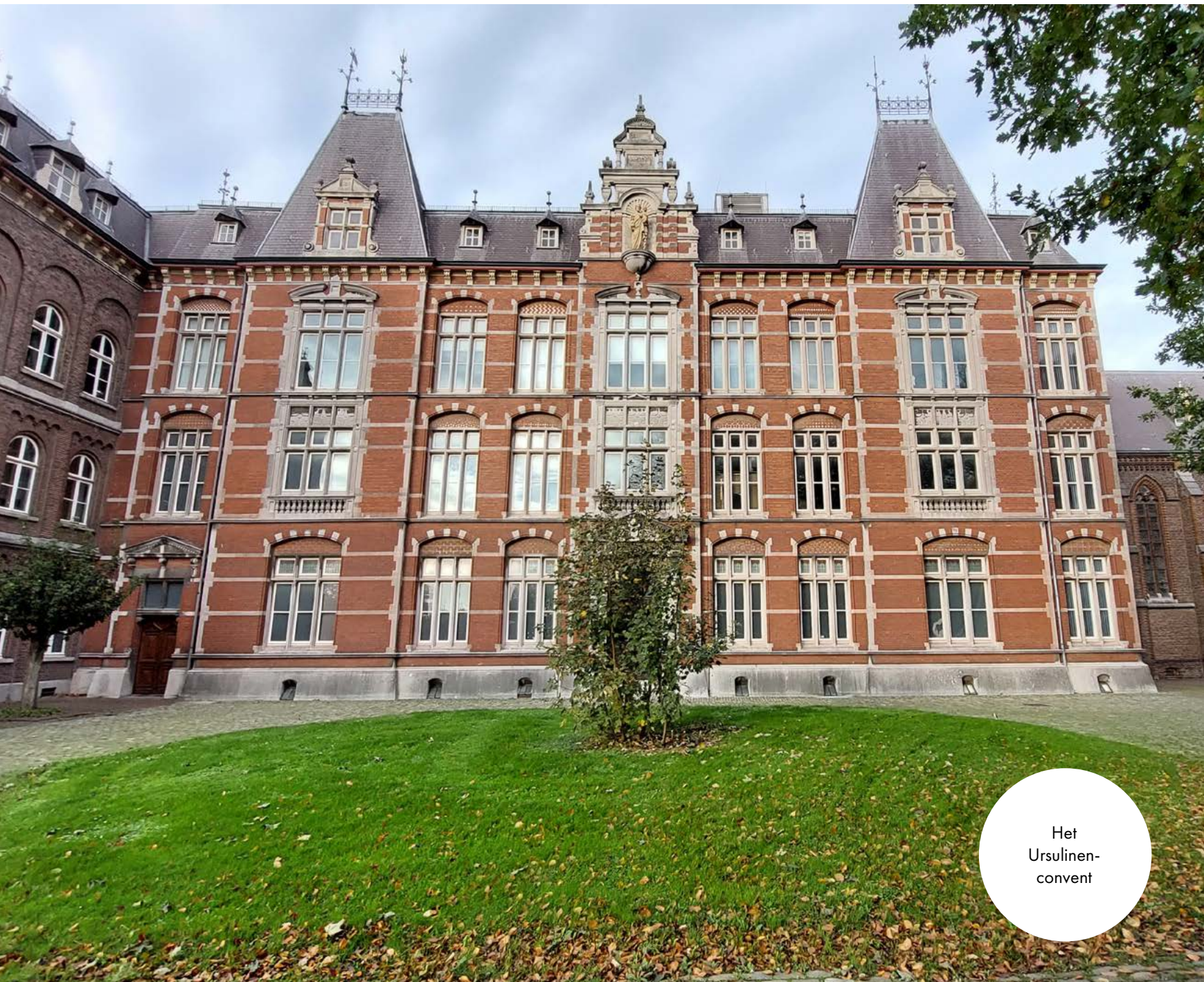
Het Ursulinen- convent

Onderweg bellen we voor de zekerheid het park waar ik een chalet heb geboekt, omdat we na sluitingstijd van de receptie aan zullen komen. We kunnen terecht, maar dienen bij aankomst een plaatsvervangende receptionist te bellen. Na ontvangst van de sleutel en de nodige uitleg kunnen we de auto naast onze tweedaagse verblijfplaats parkeren, een slaapkamerkeuze maken en onze bagage uitladen. Eten! We verblijven op de Gulperberg, en via een sterk dalend, met stenen bezaaid bospaadje strompelden we in het licht van onze mobiel naar het centrum van bruisend Gulpen. Het is al wat laat, maar gelukkig kunnen we bij Herberg De Zwarte Ruiters onze maag nog vullen en genieten van de in de nabijheid gebrouwen bieren. Na nog een andere locatie bezocht te hebben (het bruisen zou pas de volgende dag gebeuren) lopen we via het inmiddels bekende paadje terug en zoeken we, na een laatste slaapmuts – met de die middag naar de brouwerij vergeten mee te nemen kaas – in de voor woonkamer doorgaande ruimte, onze bedden op. De volgende dag staan er namelijk drie brouwerijen op de agenda.