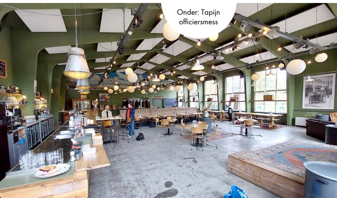
Onder: Tapijn officiersmess