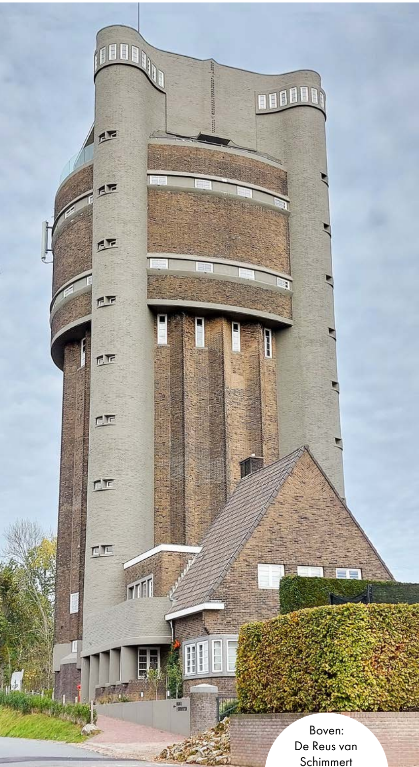
Boven: De Reus van Schimmert